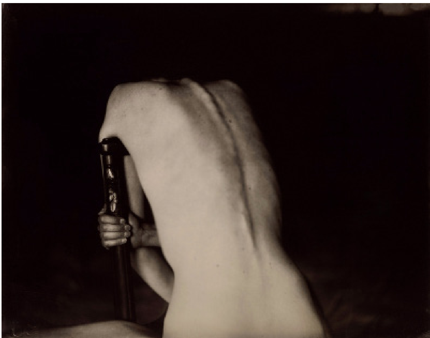
Dos de Gesa